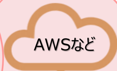
パブリッククラウド